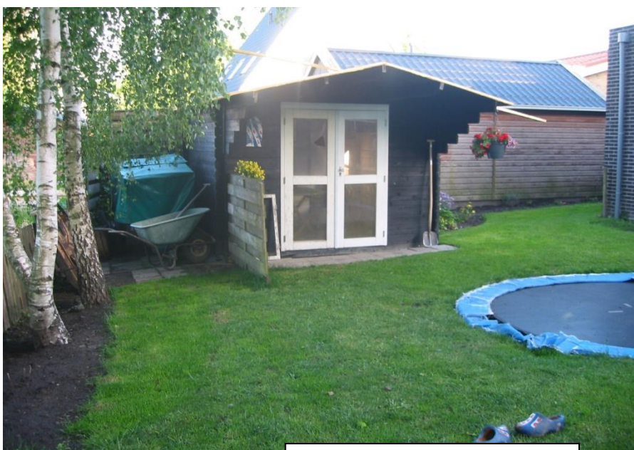
Wordt dit de nieuwe volière?

Het schoonmaken doen we ook samen, elke veertien dagen verschonen we de spaanders op de vloer, dan kan het direct in de groene container en hou je het mooi schoon. De vloer wordt dagelijks aangeveegd, want anders ligt er altijd een hoop rommel, voor de broedkooien en de binnenhokken.